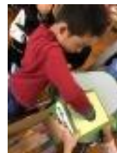
参加賞のしおり どんなのが出る かな？

読書週間の一環として、POPづくりコンテストを図書室で行いました。自分のお気に入りの本をほかの人にも勧めたいという気持ちで作成しました。作成した児童には、参加賞として、しおりがもらえ、優秀な作品（図書委員が選考）は図書室に掲示されます。読書週間は終わりましたが、これを機会に本をたくさん読んでほしいと思います。